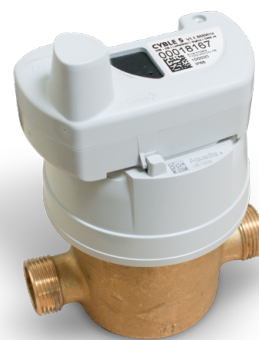
Aquadis+ equipaggiato con il modulo Cyble 5